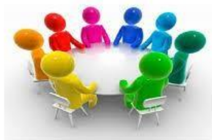
Consiglio di Istituto