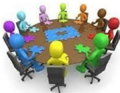
COMITATO VALUTAZIONE DOCENTI